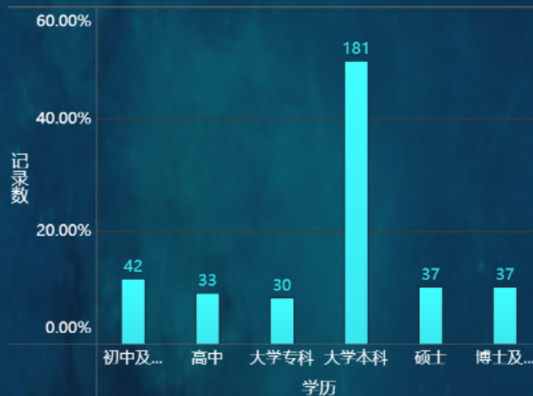
用户学历构成图表