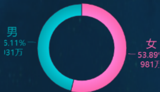
用户性别构成占比